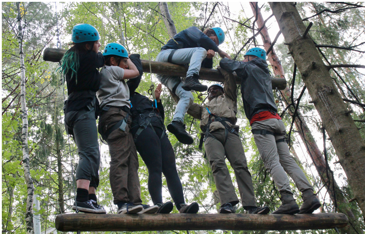
Fotografia 3. Uczestnicy kursu trenerów outdoor education „Outdoors as a Tool” 2022

konferencja „Edukacja przygodą” (dotychczas odbyły się 3 edycje) i grupa o tej samej nazwie prowadzona na Facebooku przez jej uczestników. Wydawane są również coraz liczniejsze pozycje książkowe. Aktualną, polecaną bibliografię, stara się prowadzić Pracownia Nauki i Przygody na swojej stronie „Strefa wiedzy” 16 .