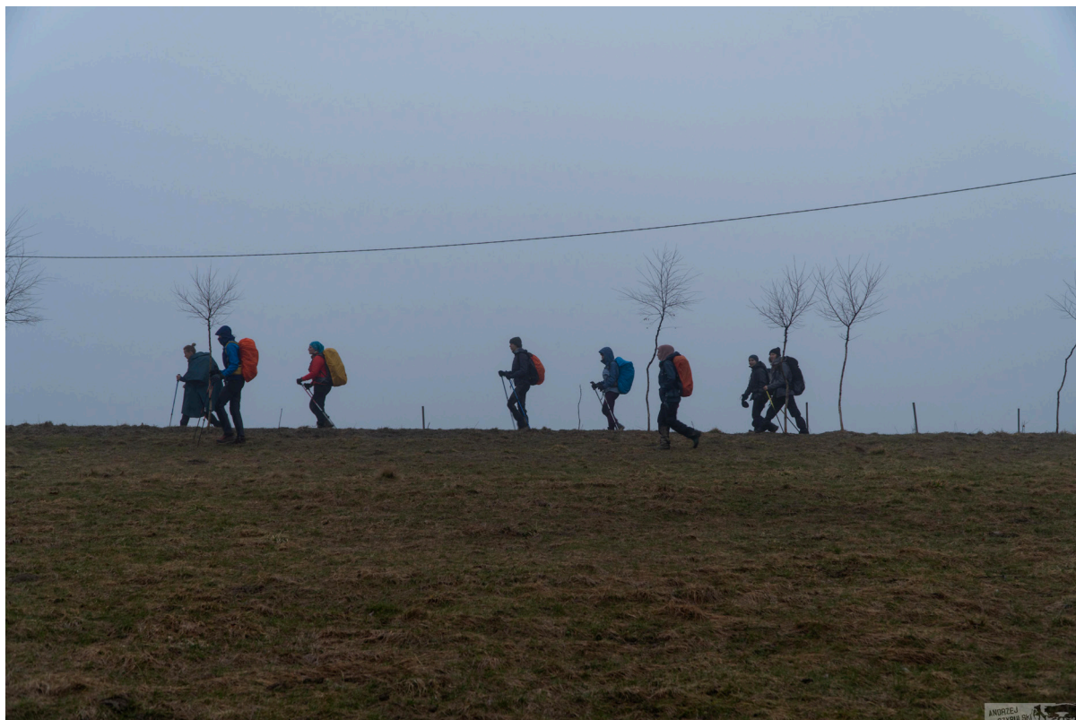
Fotografia 1. Rajd wolontariuszy Pracowni Nauki i Przygody

programami kojarzymy wielodniowe wyprawy na tratwach, skoki i wspinaczkę po drzewach, żeglarstwo ekstremalne.