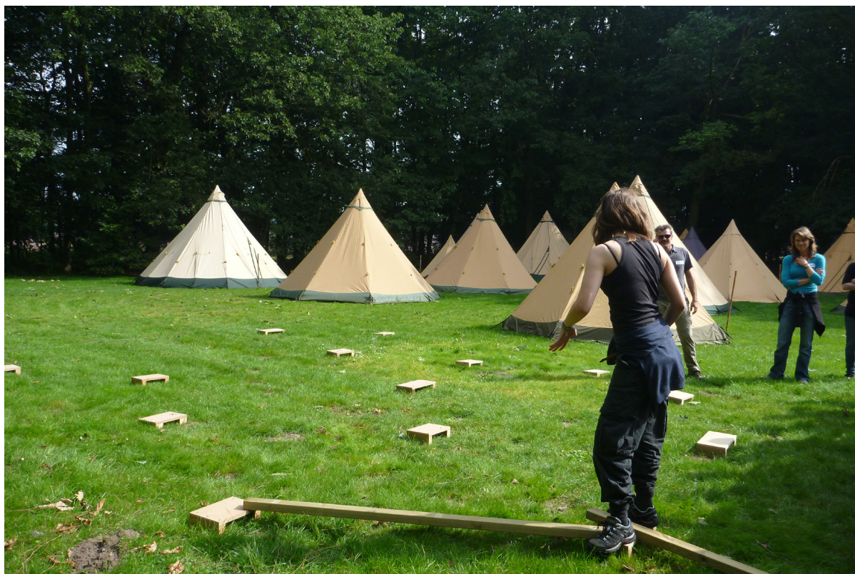
Fotografia 2. Zabawa w grę zygzak na kursie trenerów outdoorowych

samym czasie. Drugim powodem jest trudność z wykreowaniem w szkole warunków i atmosfery do realizacji tego typu aktywności. W czasie programów outdoor education powinno wystrzegać się oceniania, tworzenia hierarchicznych relacji nauczyciel-uczeń czy sytuacji ograniczonego zaufania. To dlatego programy outdoorowe spotykamy częściej na obozach młodzieżowych, kursach, w programach rozwojowych – gdzie grupie towarzyszy osoba w roli trenerskiej, a nie nauczycielskiej, przygotowana do prowadzenia tego typu aktywności i pracy z procesem grupowym. Polski nauczyciel mierzy się również z szeregiem wyzwań natury finansowej i prawnej, które utrudniają rozwój tego typu projektów. Outdoor education jest więc dosyć rozpoznawana i popularna w szkolnictwie alternatywnym oraz w działaniach organizacji pozarządowych.